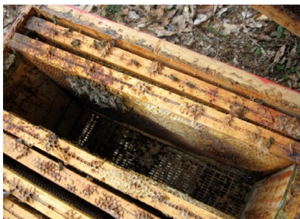
Ruche montrant des signes de syndrome d'effondrement des colonies d'abeilles