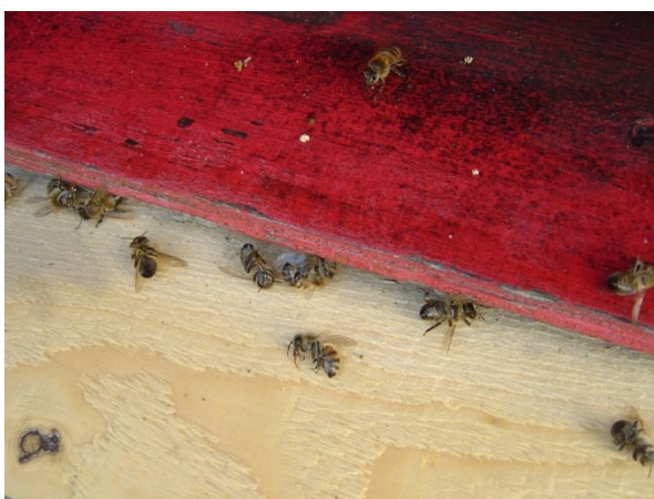
Observation de la ruche à l'aube : abeilles mortes devant l'entrée de la ruche

Traditionnellement, les pesticides étaient pulvérisés directement sur les plantes. Mais ils sont désormais également appliqués de façon systémique en enveloppant les graines d'un mélange toxique d'insecticides et de fongicides, en injectant des pesticides dans la terre, en irriguant les cultures avec de l'eau contenant des pesticides ou en injectant ceux-ci directement dans la plante. En conséquence, soit la plante absorbe les pesticides au cours de son développement, ou bien ceux-ci sont diffusés directement à travers toute la plante, fleurs y compris. Les insectes qui se nourrissent de pollen, du nectar de la plante, ou qui boivent de l'eau traitée aux pesticides, sont donc exposés petit à petit aux pesticides qui restent dans la plante durant de longues périodes. Même si les concentrations présentes ne les tuent pas instantanément, l'exposition répétée à de petites quantités de pesticides peut avoir un impact sérieux sur la santé des abeilles. En outre, les pestici-